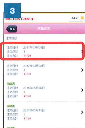
③ 注文した日付をクリックします。