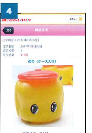
④ 注文した日の詳細を確認できます。