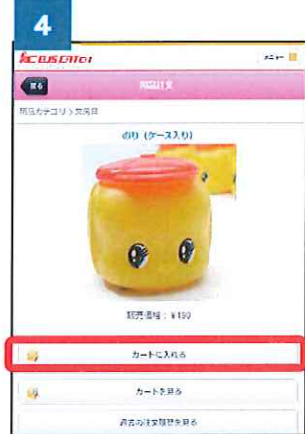
④ 「カートに入れる」をクリックします。