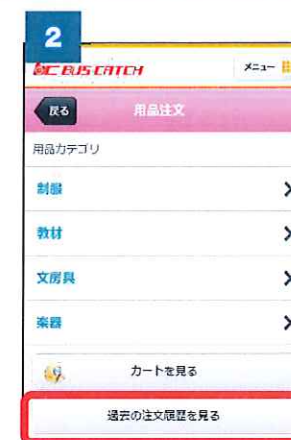
② 「過去の注文履歴を見る」をクリックします。