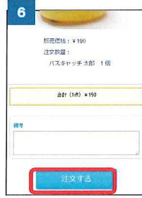
⑥ 「注文する」ボタンをクリックします。