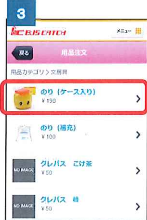
③ 注文する用品をクリックします。