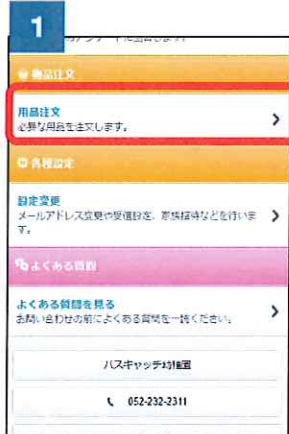
① メニューから用品注文をクリックします。