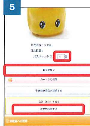
⑤-1 個数に変更がある場合は、個数を入力し、「数量を確定」をクリックします。 ⑤-2 「注文を確認する」をクリックします。